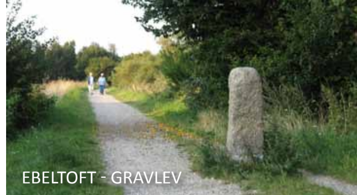
EBELTOFT - GRAVLEV

Den nedlagte jernbanestrækning "Gravlev Stien" fra Ebeltoft mod Gravlev byder på varierede cykel- og vandreoplevelser ad den nedlagte banestrækning fra 1901. Stien er 8 kilometer lang og løber fra P-pladsen i Gravlev gennem store plantageområder, over åbne engarealer ved Stubbe sø, til morænelandskabet ved Ebeltoft.